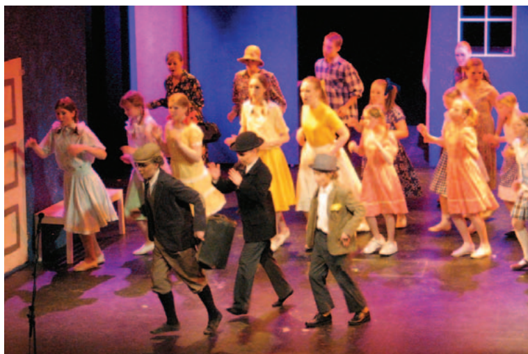
GODT ETABLERT: Samarbeidet mellom opera og kulturskole begynte for fem år siden og er i dag godt fundamentert.

- Rollene ble fordelt før jul, men den intensive jobbingen startet like før påske. I likhet med idrettsutøvere, er det om å gjøre å finne formtoppen til mesterskapene. I tillegg til stor-slagent scenarium med masse flott musikk, sang og dans, ønsker vi også å skape en setting for publikum i det de trækker inn i teateret. Det er viktig å skape ringvirkninger av det som foregår på scenen, og dermed gi publikum en helt unik opplevelse, avslutter Dullaert.