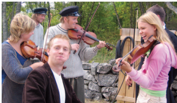
OPERAØVELSE: Trivsel på en tidligere øvelse på operaen "Fiskaren Rasmus og felemusikken" som Fræna kulturskule setter opp også i forbindelse med 40-årsjubileet.