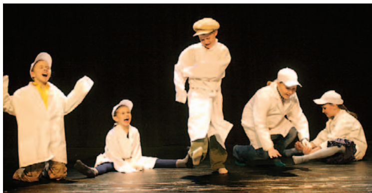
UNGE AKTØRER: Skuespillerne i den samiske oppsetningen av "Charlie og Sjokoladefabrikken" var i alderen åtte til tolv år.

Men en dag annonserer Willi Wonka en stor gullbillettjakt. Han deler ut fem gullbilletter, som kan befinne seg i en hvilken som helst WW-sjokolade. Det virker Ganske håpløst at Charlie skal finne noen billett, men mirakuløst nok skjer nettopp dette, og Charlie får komme inn i den for ham mest vidunderlige fabrikk i verden. Og publikum fikk så følge Charlies opplevelser i fabrikk.