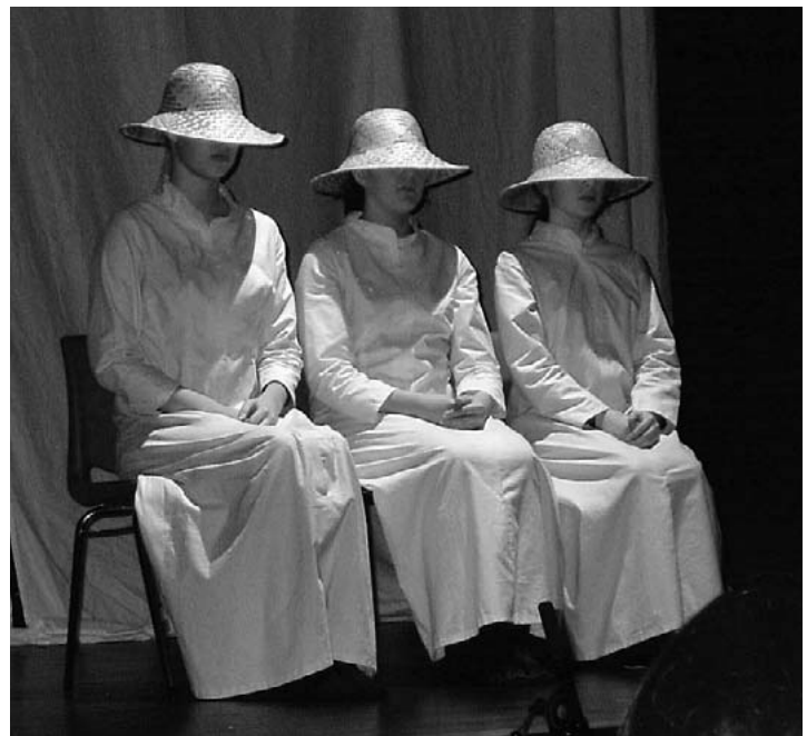
TOSPRÅKLIG BECKETT: Flekkefjordelevene framførte en forestilling som var både norsk- og engelskspråklig.

- Siden våren 2006 har gruppa utviklet en forestilling, med utgangspunkt i Samuel Becketts "Come and go". Under vår veiledning har gruppa arbeidet tverrfaglig med improvisasjon, musikk og tekniske virkemidler, i tillegg til originalteksten. Resultatet ble en meget spesiell forestilling, som er både engelsk- og norskspråklig, sier Sølvi Wiulsrød.