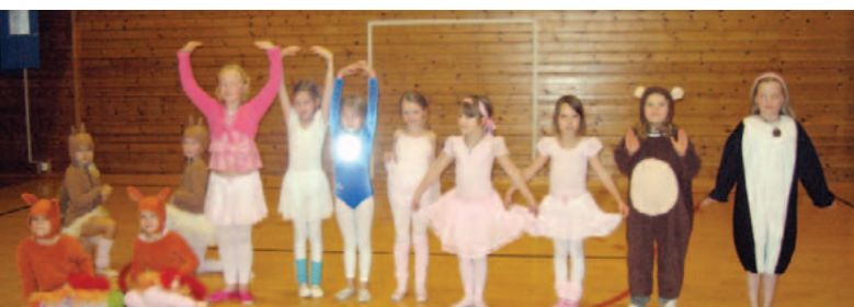
UNGE & YNDIGE: Dans er også veletablert som fag i Fræna kulturskule.

Et trist kapittel i skolens historie ble skrevet i 1986/87. Da mistet skolen statsstøtten på grunn av høy skolepengesats og lav kommunal økonomisk andel.