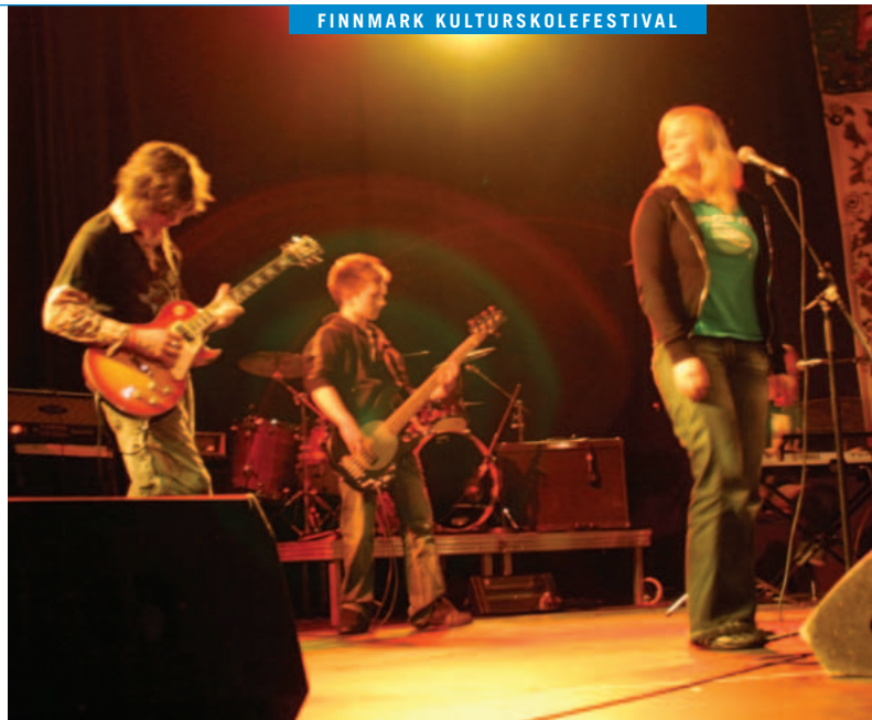
ROCK I NORD: Ett av de fire rockebandene som deltok på årets Finnmark kulturskolefestival.

- De hadde bare to dager på å forberede seg, og leverte veldig flotte bidrag under forestillinga, sier han.