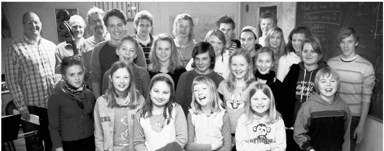
HELE GJENGEN: Samtlige deltakere og instruktører i skjønn og glad forening.