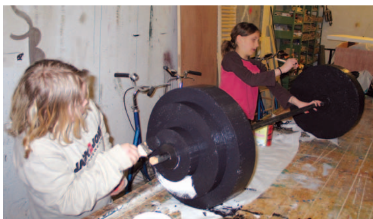
TEKNISK STAB: Mye arbeid må gjøres bak scenen også ved en musikkteaterskole.