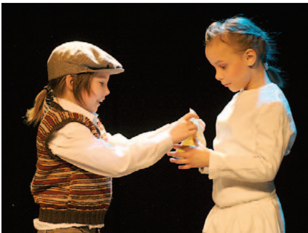
FØRSTE GANG: Deanu kulturskuvla alias Tana kulturskole skrev norsk og samisk teaterhistorie med "Charlie ja šukuládefabrihkka".