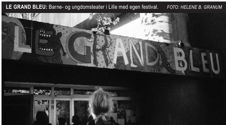
LE GRAND BLEU: Barne- og ungdomsteater i Lille med egen festival.