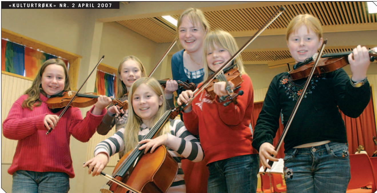
De unges orkesterforbund Nordland håper flere nordnorske kommuner prioriterer et godt strykeopplæringstilbud i sine kulturskoler.